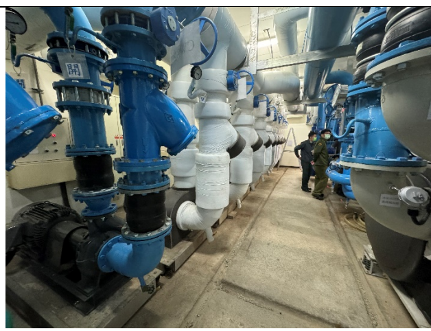
110 年國軍台中總醫院；總工程款 800 萬，補助款 240 萬，節能率 42.86%。 工程內容汰換 450RT 主機及附屬設備(冷卻水泵及冰水泵)。