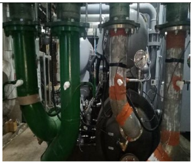
112 年臺中榮民總醫院；總工程款 1200 萬，補助款 4,00 萬，節能率 47%。 工程內容汰換 250RT 冰水主機*1 台、180RT 冰水主機*1 台及附屬設備。